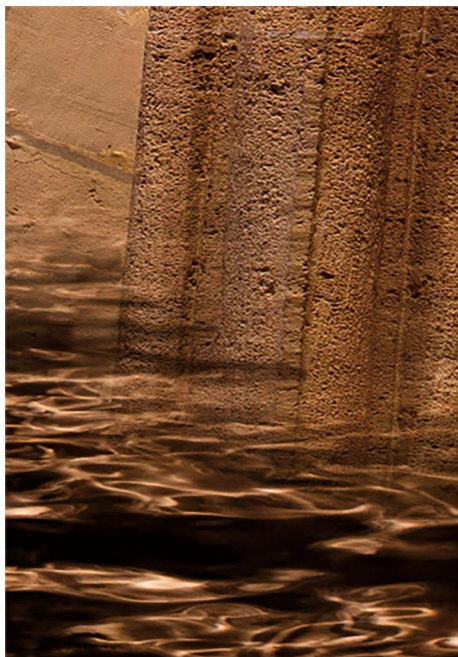
Toile montée sur châssis 200 x 140 cm