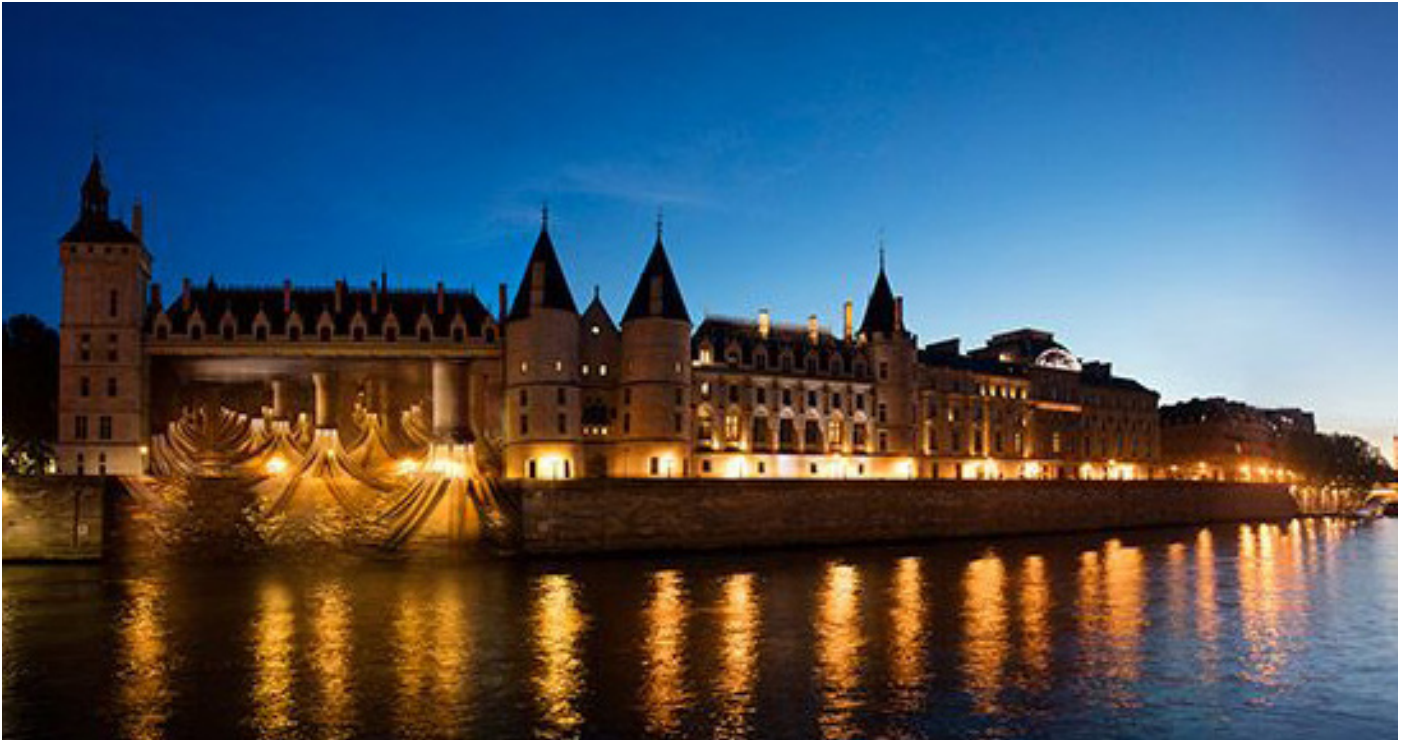
Pierre Delavie, Cote 15,28 , Nuit Blanche 2016, Façade de la Conciergerie, Samedi 1er octobre