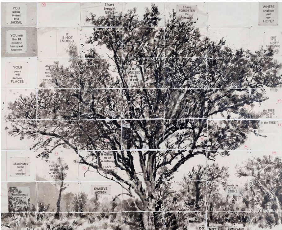
More Sweetly Play the Dance , William Kentridge, exposition au Mudam Luxembourg soutenue par la fondation Loo & Lou, du 13 février au 30 août 2021