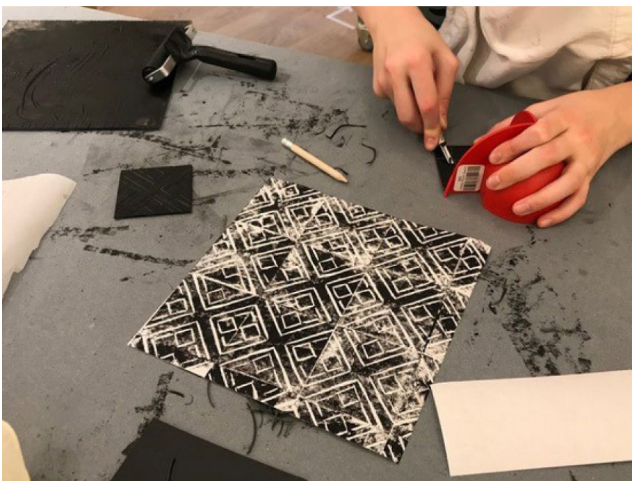
Atelier Art Freak

La Fondation Loo&Lou est un précieux soutien pour les expositions artistiques. Grâce à son engagement en faveur de l'art, elle offre un appui essentiel aux institutions et aux artistes, favorisant ainsi la création et la diffusion des œuvres. La Fondation s'engage à travers des subventions, des bourses et des partenariats, permettant ainsi aux expositions de prendre vie. Son soutien financier et logistique permet à des projets souvent monumentaux de se réaliser, contribuant ainsi à l'épanouissement de ses artistes qui voient en grand. L'exposition de Lydie Arickx au château de Chambord en 2021 est un témoin éloquent de cette promesse.